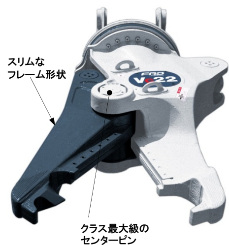
スリムな フレーム形状

カッターの切れ味を維持するため、センターピン径を大きくし、超高強度鋳鋼一体構造フレームを採用した軽量・強靱な鉄骨カッターです。強力なカッター切断力で重量鋼材もラクラク切断します。