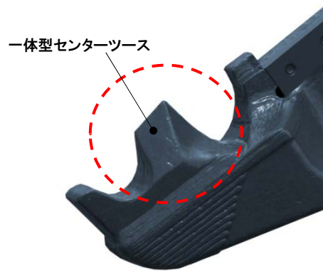
一体型センターツース

破碎効率を追求した一体型大型くさび形状センターツースでコンクリート大塊も強力な圧砕力でラクラク圧砕します。また、先端歯は鉄筋等がつかみやすい形状にしています。